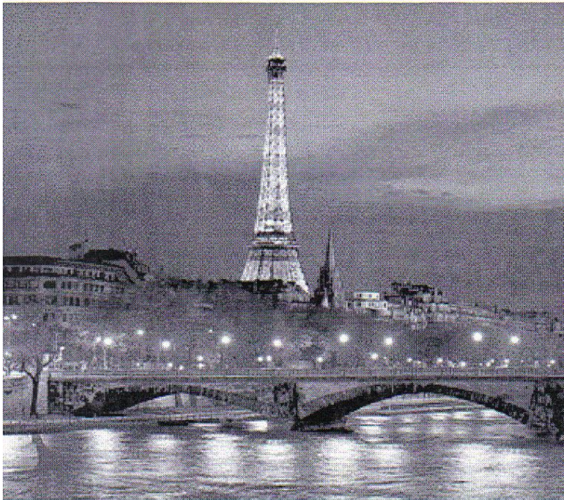
La Tour Eiffel est un des monuments les plus reconnus au monde.

Excursion optionnelle à Versailles • Joignez-vous à une excursion optionnelle à Versailles, résidence de rêve de Louis XIV. Ici, le Roi-Soleil tenait cour selon un style caractérisé par un faste inimagin-